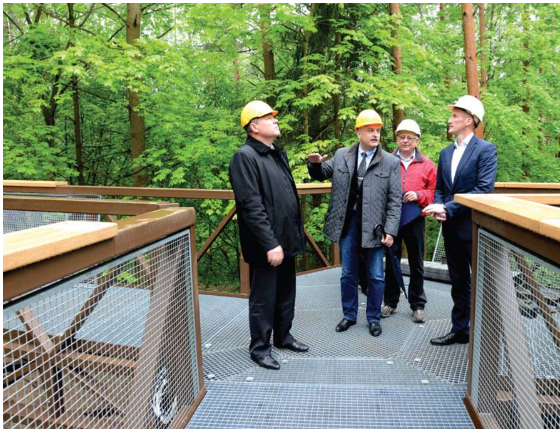
Pirmasis Lietuvoje lajų takas tęsiasi 300 metrų.

Lajų tako statyboms Anykščių šilvelyje artėjant prie finišo iškilo problema, iš kur gauti pinigų tako eksploatacijai.