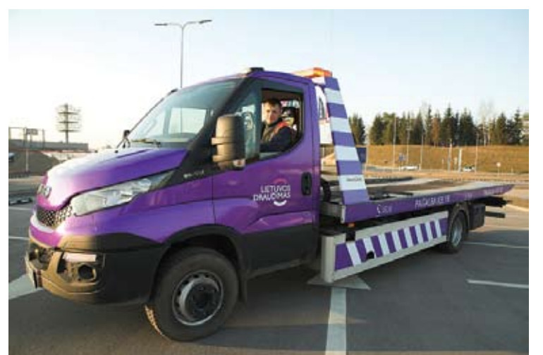
Vairuotojai, „Lietuvos draudime“ apsidraudę metiniu privalomuoju draudimu, kartu gauna pagalbos kelyje paslaugą visą parą visus metus visoje Lietuvoje.

Būtent nutempti automobilį dažniausiai ir prireikia klientams. Tokia pagalba suteikiama trimis atvejais iš keturių. Dažniausiai taip nutinka dėl elektros sistemos gedimų, variklio ar sankabos problemų. Kas ketvirtam klientui pagalba pavyksta suteikti vietoje – jei automobilio salone buvo užtrenkti rakteliai, baigėsi degalai, išsikrovė akumulatorius arba pradurta pa-