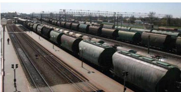
Lydos geležinkelio stotis.