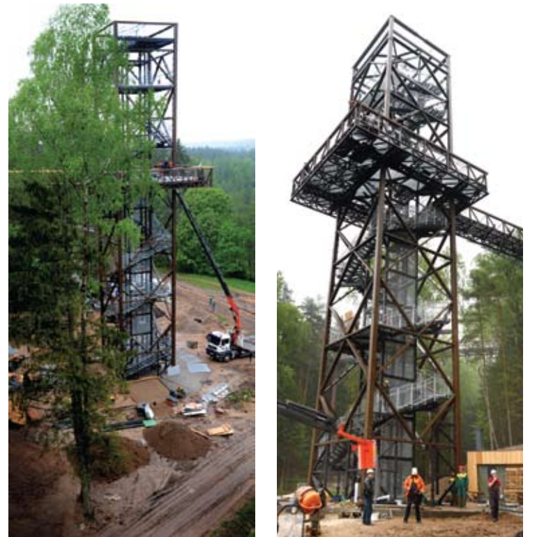
Taip atrodo lajų tako bokštai.