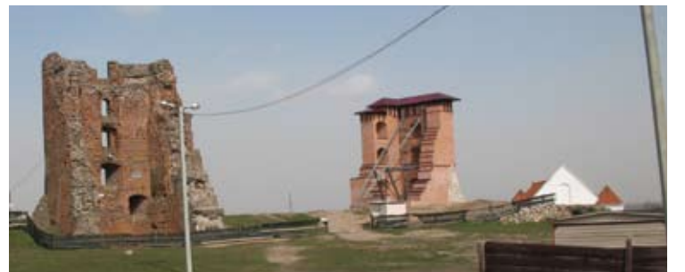
Nauja Naugarduko pilis bus gražesnė nei senoji. Daug gražesnė...