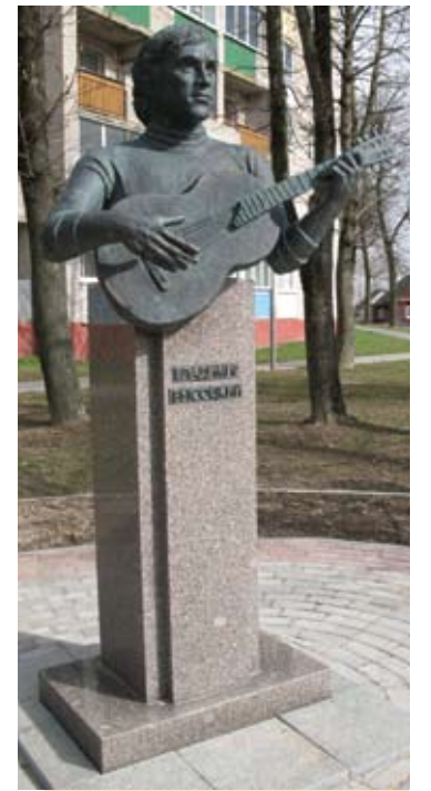
Kuklus paminklėlis bardui Vladimirui Visockiui Naugarduke. Man dėl šio paminklėlio Naugardukas tapo daug mielesnis...

rublių, į tualetą prasprukau už metalinį eurą, o tai yra keturis kartus daugiau nei oficiali 3 tūkst. 500 rublių paslaugos kaina. Ach, kaip artistiš-kai administratorė savo mimikomis mane smerkė, nužiūrino, galvodama, kokį sprendimą priimti, kol galų gale kilniai atsiduso ir oriai pratarė „Da ladno...“ („Na, gerai...“)