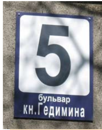
Bene tik Gedimino vardo iš mūsų didžiųjų kunigaikščių, slavai neiškraipo.